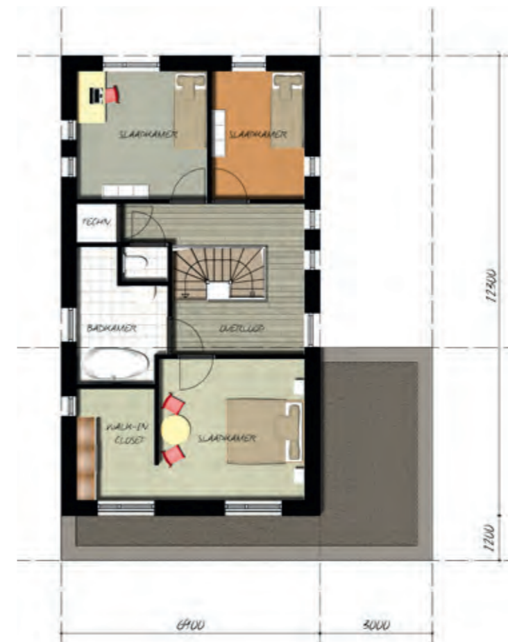
< EERSTE VERDIEPING