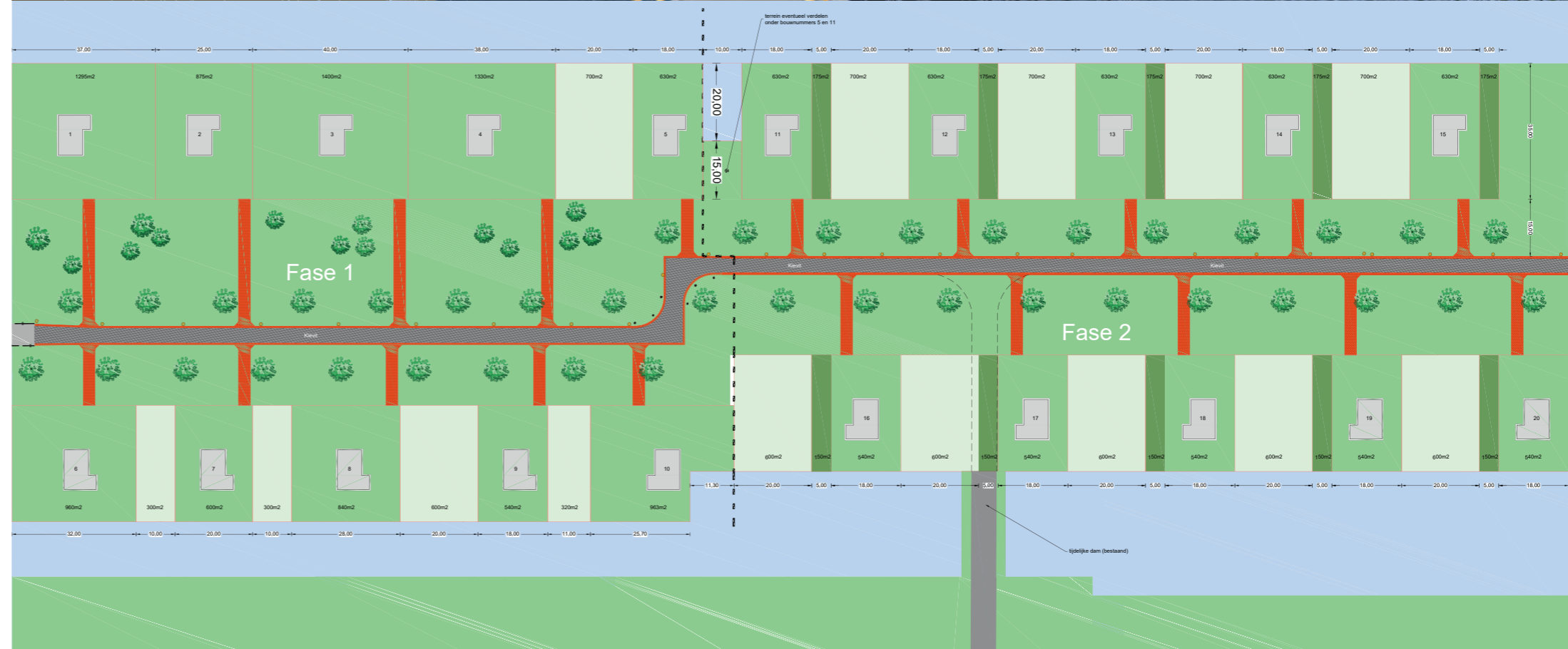
Deze situatietekening is indicatief. Het is niet uitgesloten dat zich wijzigingen voordoen