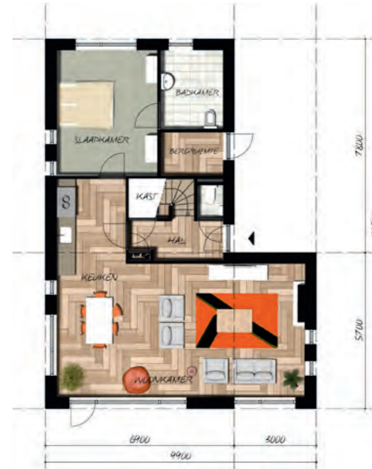
< BEGANE GROND (levensloopbestendig)